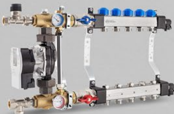
Fördelare med reglerventiler, ventiler till ställdon och system för blandning med elektronisk pump. - USVP serien