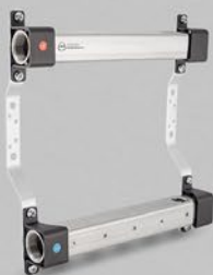
Fördelare med interna gängor 1/2" - RBB serien