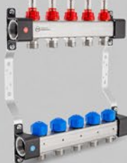
Fördelare med flödesmätare och ventiler för ställdon UFS serien