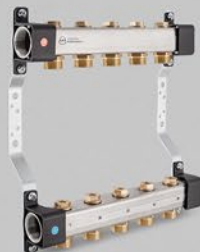
Fördelare med nippel 3/4" och avstängningsventiler - RVV serien