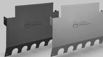
* på individuell beställning, finns den tillgänglig i antracit eller stål