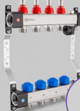
Fördelare med flödesmätare 2,5 l/min eller 5 l/min (max) och ventiler för ställdon och en ventilsektion UFST och UFST max serien