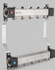
Fördelare med reglerventiler - UVN serien