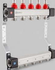
Fördelare med lödesmätare UFN serien