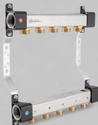
Fördelare med -nippel 3/4" - RNN serien