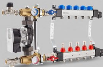
Fördelare med flödesmätare, ventiler till ställdon och system för blandning med elektronisk pump. - USFP serie