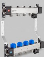
Fördelare med reglerventiler och ventiler för ställdon och ventilsektion - UVST serien