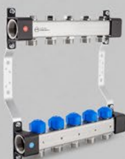
Fördelare med reglerventiler och ventiler till ställdon - UVS serien